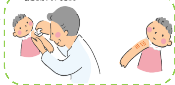
接種を行っているところ